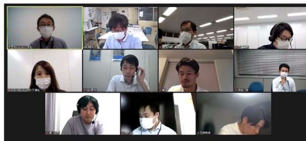
写真1 オンラインによるWGの様子

昨年度までは、入職者アップに対する活動が中心であり、離職率ダウンに対する活動を新たな方針とし、活動内容を検討しました。