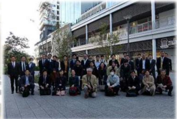
▲参加者の集合写真