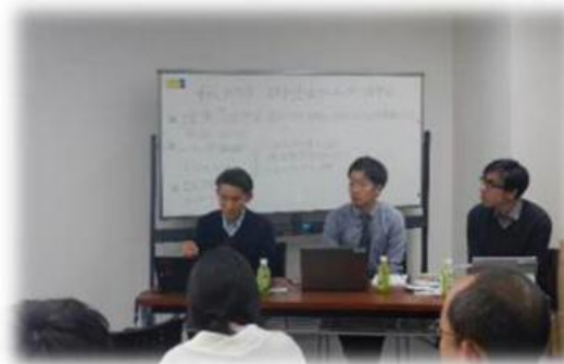
▲コンサルタントからの実務紹介