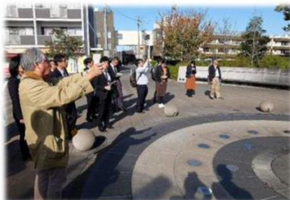
▲解説付き公園見学会の様子

近年、公園緑地において多種多様なニーズが求められている中、名鉄太田川駅前どんでん広場は都市構造の変革と地域の活性化、地域文化の発信のため、駅前の市街地に緑を主とした広場と歩道を形成し、人々の交流やコミュニティ活性化の新しいにぎわいのステージとして利用されています。また、本広場はデザインが優れていることが高く評価され、第29回都市公園コンクールにおいて国土交通大臣賞を受賞されています。整備されてから数年が経過した広場を中心に、設計コンセプトをはじめ、こだわりのディテールなど、具体的な事例をとおして多くのことを学ぶため、講習会・見学会を実施しました。